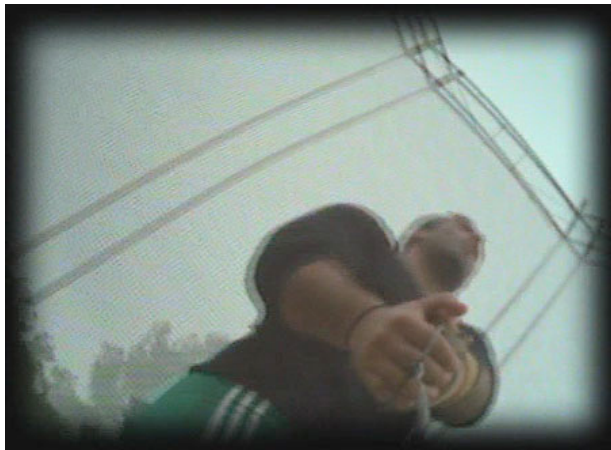
"The Champion", de Rui Avelans Coelho

LE FIL CINÉMA - Ce week-end, au Centre Pompidou, à Paris, avec le festival Pocket Films, le Forum des Images célébrait sa grand-messe technophile, dédiée depuis quatre ans aux films réalisés avec un téléphone portable... Nouveau support de création et de circulation des œuvres, le mobile intéresse bien au-delà du petit monde du cinéma expérimental.